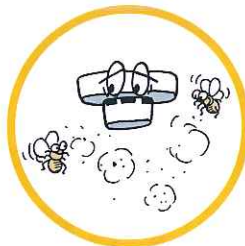
ホコリや小さな虫