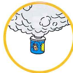
くん煙式殺虫剤など