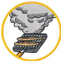
調理時の煙や湯気