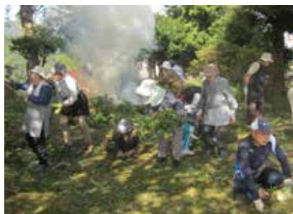
豊作を願い神社清掃