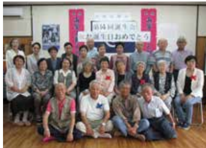
誕生を祝す温かい笑み