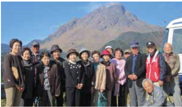
普賢岳の紳士・淑女