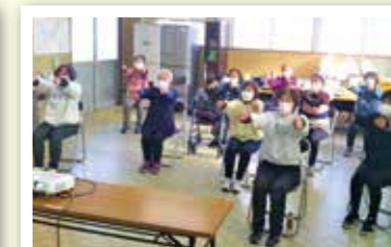
100歳目指して頑張ります!!

【問い合わせ】健康長寿課 高齢者支援係(地域包括支援センター) ☎25-2391