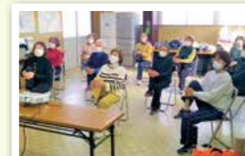
足を上げて転倒予防!