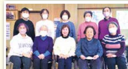
皆さんの参加をお待ちしています

令和7年1月16日より「元町健康クラブ」として元町公民館で「いきいき100歳体操」を15人で始めました。『地域の方々との交流を大切に』『楽しく健康な毎日を過ごす』をモットーに!!現在は60歳代～80歳代の方々が頑張っておられます。入会はいつでもOKです。お気軽に見学に来てください。