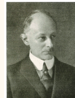
ベルンハルト・ドレーガー 1870年～1928年