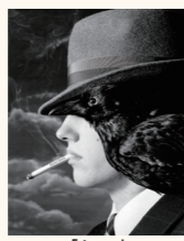
[Jazz] (ファッションブランド広告)

デヴィッド・ボウイ(1947-2016)やYMOのアルバムカバー写真を手がけたことで知られる、直方市出身の世界的写真家、鋤田正義(1938-)。本展は鋤田のこれまでの活躍をまとめた作品群が直方谷尾美術館に寄贈されたことを記念した展覧会です。この度、寄贈された作品数はおよそ300点。その中から選りすぐりの作品を2026年から2年に一度、全5回の展覧会を通して紹介します。