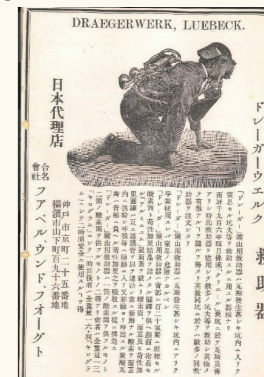
ドレーガー製救命器 1907年製(当館収蔵)

炭鉱は非常に危険な職場で、多くの鉱夫達の命を奪いました。その炭鉱事故で救護の際に活躍したのが救護隊の救命器です。当館には、その歴史的に貴重な救命器を多数展示しており、その中から、初期の救命器や現在の救命器について解説展示しております。是非、ご来館ください。