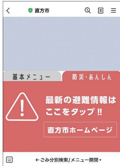
※画像は開発中のものです