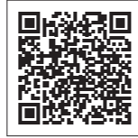
▲「災害時情報共有プラットフォーム」はこちら

市では、災害時の情報共有を目的とした「災害時情報共有プラットフォーム」を運用しています。災害時に必要な情報をリアルタイムで確認できます。