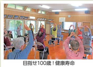
目指せ100歳！健康寿命

【問い合わせ】健康長寿課 高齢者支援係(地域包括支援センター) ☎25-2391