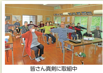
皆さん真剣に取組中