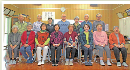
平均年齢79歳の若人たち