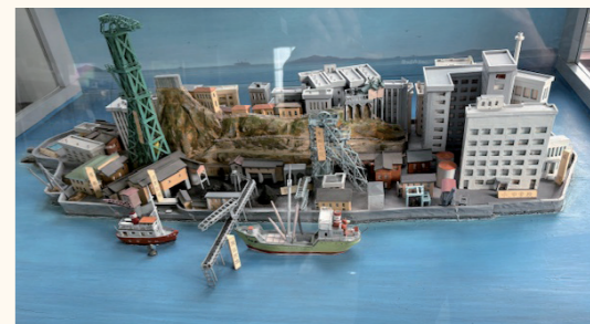
(三菱端島炭鉱全景模型)

1810年頃に石炭が発見された端島(軍艦島)は、佐賀藩が小規模な採炭を行っていました。1890年(明治23年)に三菱合資会社の経営となり、本格的な海底炭鉱として操業開始後は出炭量が増加し最盛期には約5300人が住み、当時の東京都の9倍の人口密度に達しました。国のエネルギー政策が石炭から石油に移ったことで1974年に閉山し、同年に無人島になりましたが、2015年(平成27年)に世界文化遺産に登録されました。