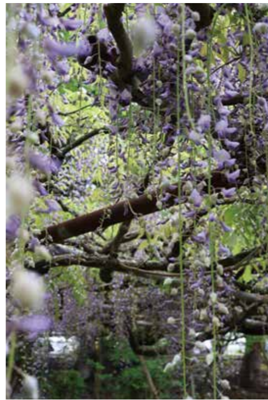
▲福智山ろく花公園の藤の花。紫のカーテンが美しい。 投稿者:@taeko.t919315さん

市内での身近なことや、風景、思い出を気軽に投稿してください。 フォトグラファー募集企画についての詳細は市ホームページをご覧ください。