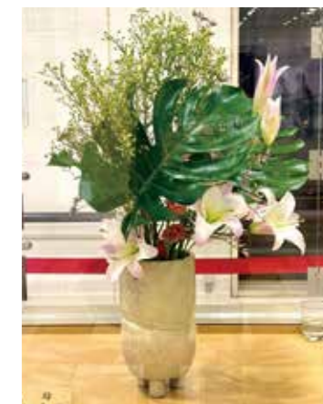
▲JR直方駅の生け花展示

毎週入れ替わり、季節を感じられる花は、駅を訪れる人々の心に彩りを添えてくれます。駅へお越しの際はぜひ花の変化をお楽しみください。(※気温や湿度等により、展示条件は変更になることがあります)