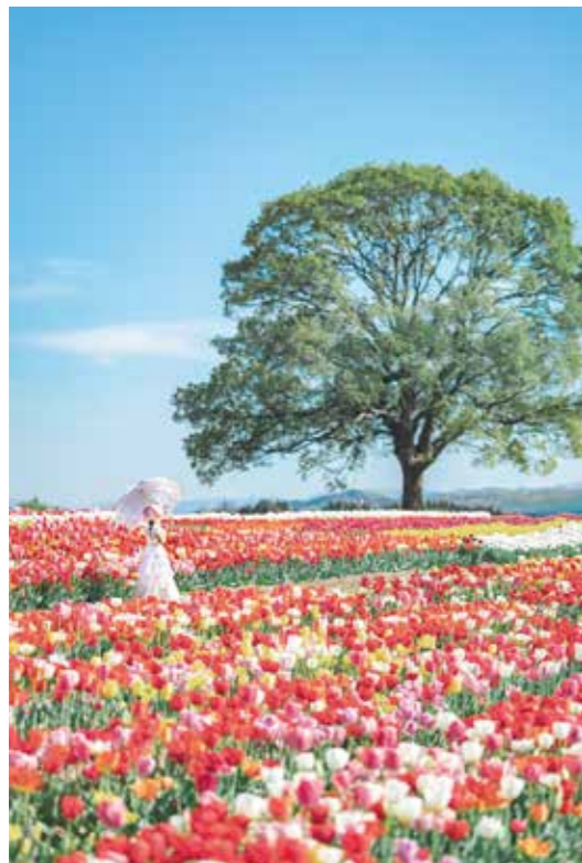
▲まるで童話の世界のよう。のおがたチューリップフェアでの1コマ。