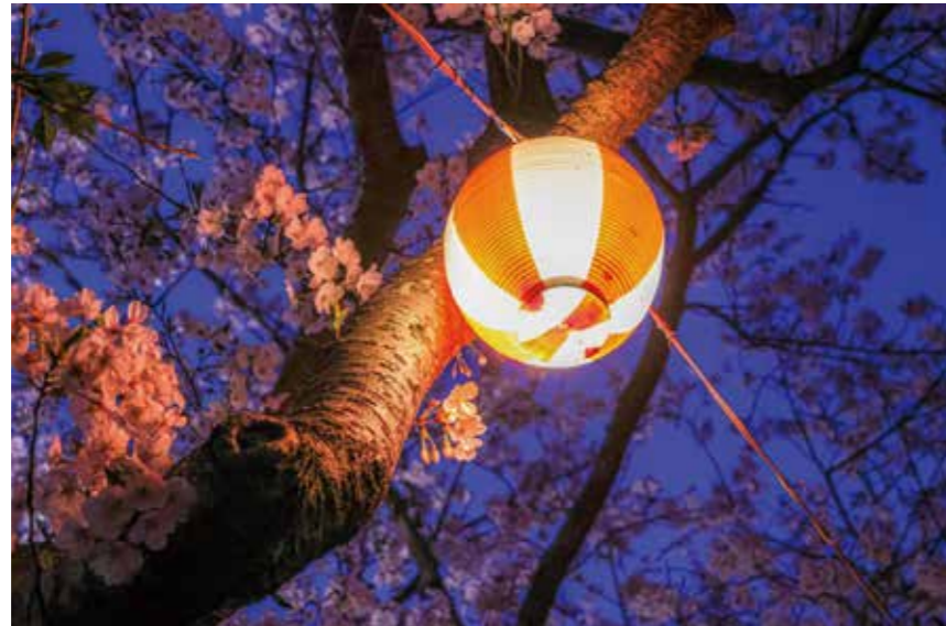
▲遠賀川河川敷の提灯に照らされた、夜桜。淡く、幻想的です。

5月25日までに市のInstagramアカウント(@nogata_city)をフォロー＆「#きらきらのおがた」のハッシュタグをつけてInstagramに投稿された作品の中から、選定した写真を紹介します。たくさんのご応募ありがとうございます。