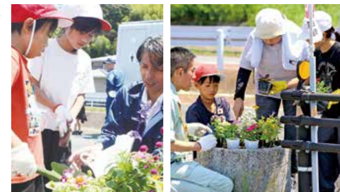
▲福地小学校3年生と地域の人たちとの交流のようす

日々の花壇のお手入れや、街角の小さな緑化活動を通じて、花のあるまちづくりを一緒に進めてみませんか?