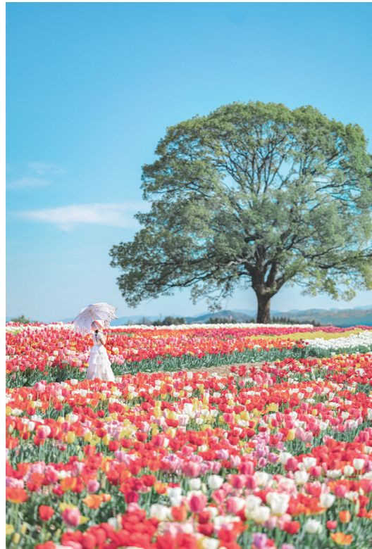
▲まるで童話の世界のよう。のおがたチューリップフェアでの1コマ。