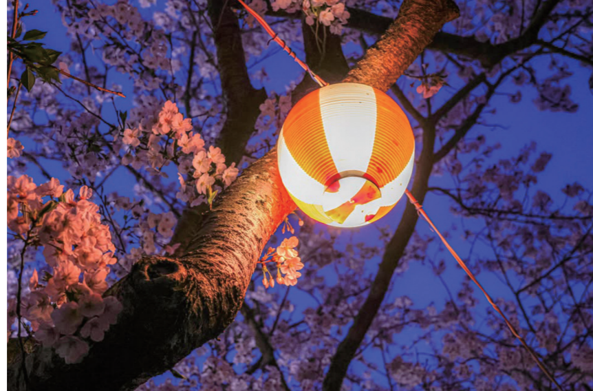
▲遠賀川河川敷の提灯に照らされた、夜桜。淡く、幻想的です。

5月25日までに市のInstagramアカウント(@nogata_city)をフォロー＆「#きらきらのおがた」のハッシュタグをつけてInstagramに投稿された作品の中から、選定した写真を紹介します。たくさんのご応募ありがとうございます。