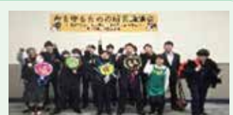
防災イベント参加