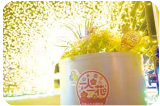
▲「のおがた高校生フラワーコンテスト」にて制作されたプランターとイルミネーション

【イルミネーションに関する問い合わせ】都市計画課 公園街路係 TEL:25-2200