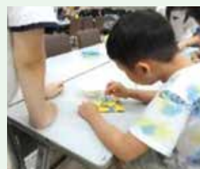
リサイクルサシェづくり