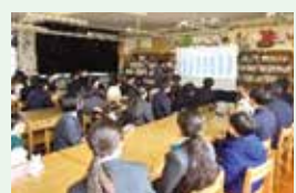
小高連携活動 ビジネスモデル