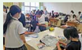
小高連携活動 エプロンづくり