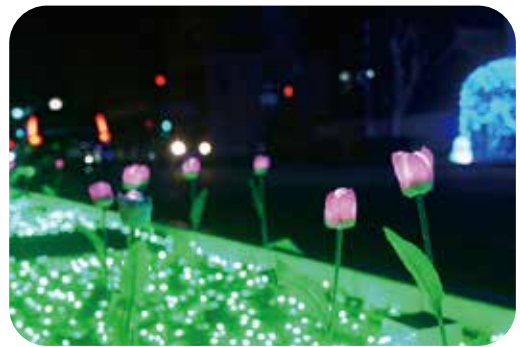
▲光輝くイルミネーション(チューリップ)