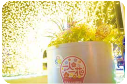
▲「のおがた高校生フラワーコンテスト」にて制作されたプランターとイルミネーション

【イルミネーションに関する問い合わせ】都市計画課 公園街路係 TEL:25-2200