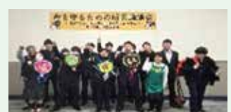
防災イベント参加