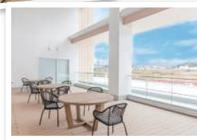
ゆったりと寛げるラウンジと、遠賀川や福智山の景色を愉しめるテラス。