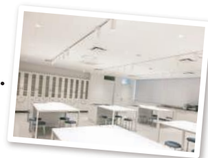
ガラス張りの栄養指導室。冷蔵庫を含む、様々な調理器具が充実しています。