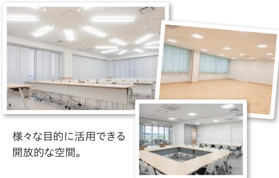
様々な目的に活用できる開放的な空間。